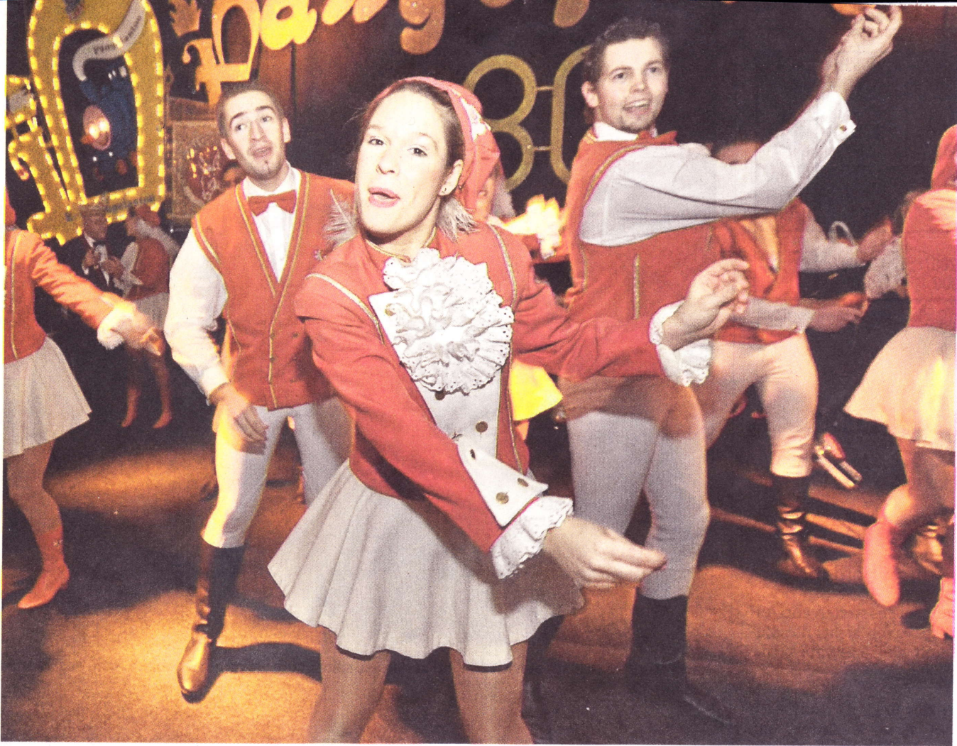
136 Kilometer für zwei Tänze und zwei Zugaben: Das Tanzkorps „Rot-Weiß Bechen“ besuchte am Samstag die KG Pängelanton in der Halle Münsterland. Als einer von sieben Acts an diesem Abend begeisterten die Akteure mit Akrobatik und Tanz.