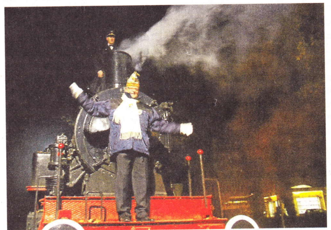
Wie auch im vergangenen Jahr lädt die KG Pängelanton morgen zum „Lok-Anheizen“ ein.