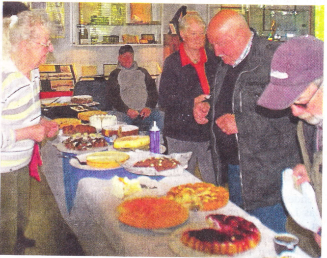
Das Maifest der KG Pängelanton findet in jedem Jahr großen Anklang bei den Besuchern. Besonders begehrt: die Erbsensuppe (Foto o.) und das große Kuchenbuffett im Eisenbahnmuseum.