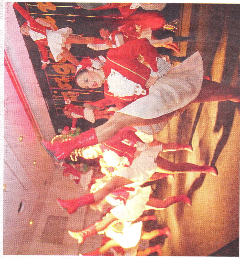
Die akrobatischen Auftritte der professionellen Tanzoffiziere und Mariechen des Tanzcorps Rot-Weiß Bechen gelten als Höhepunkt der Gala in der Halle Münsterland.

Tanzcorps Rot-Weiß Bechen bei Pängelanton-Gala